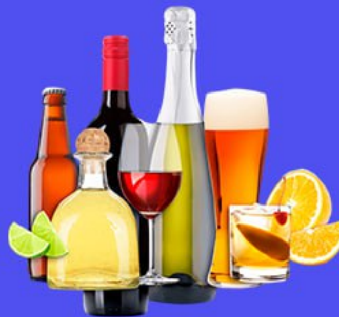
Избыточное потребление алкоголя