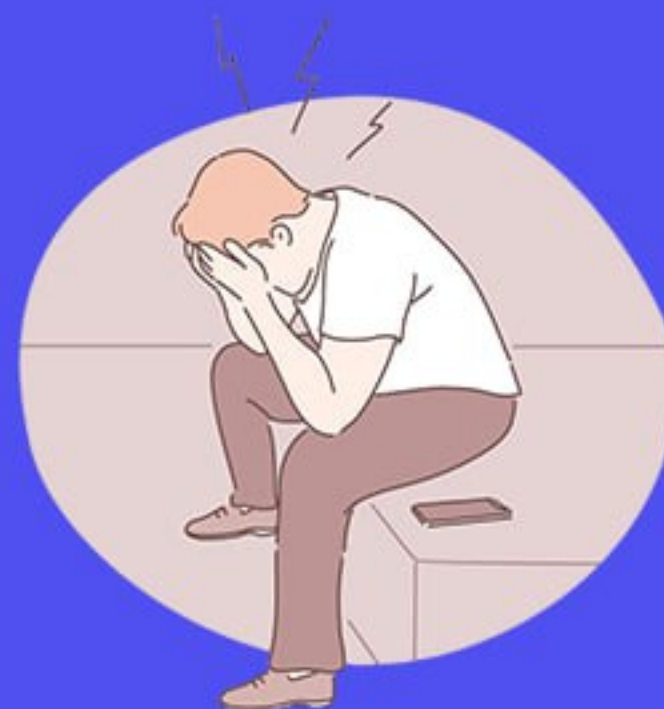
Стресс, тревога, депрессия