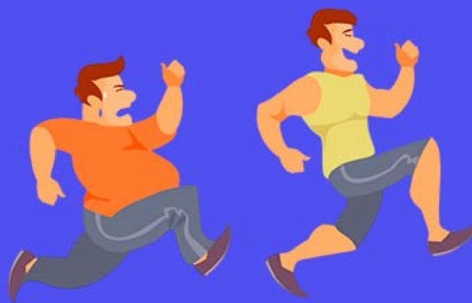
Низкая физическая активность